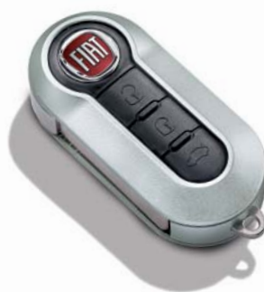
Matt Silver szürke