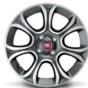
50902778 16" -os sötét gyémántfényű könnyűfém keréktárcsák (Lineaccessori)