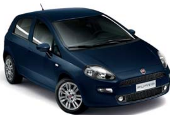
475 RIVIERA KÉK