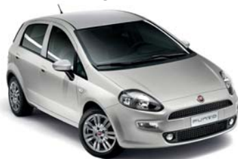
348 SILVER SZÜRKE*