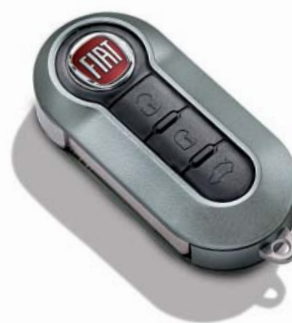
Matt Titanium szürke