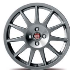
50902243 17" -os sötét gyémántfényű könnyűfém keréktárcsák (Lineaccessori)