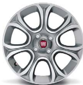
439 16"-os gyémántfényű könnyűfém keréktárcsák 195/55 R16 gumiabroncsokkal (hólánccal nem szerelhető rá)