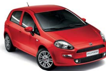
176 PASSIONE PIROS* (extra fényezés)