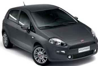
679 MODA SZÜRKE*