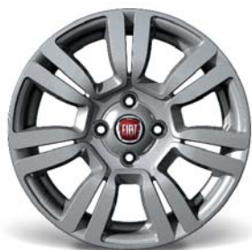
108 15"-os könnyűfém keréktárcsák 185/65 R15 gumiabroncsokkal