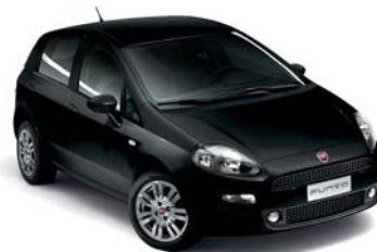
876 TENORE FEKETE*