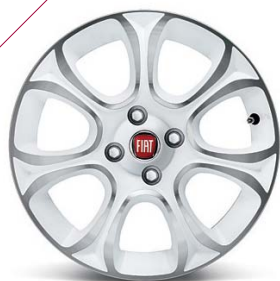
50902779 16" -os fehér gyémántfényű könnyűfém keréktárcsák (Lineaccessori)