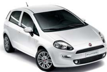
296 GELATO FEHÉR* (extra fényezés)