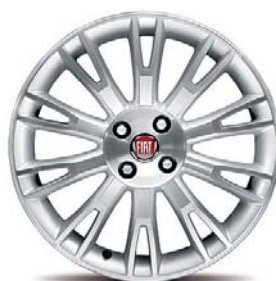
50901339 17" -os könnyűfém keréktárcsák (Lineaccessori)